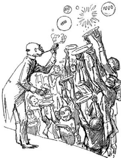
Gaukelspiel der Kalorien (1946)

"Le mirage des calories". En 1946, le caricaturiste Mirko Szweczuk illustre la difficile situation alimentaire dans l'Allemagne d'après-guerre.