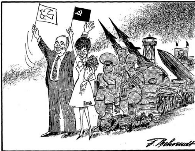
Ein neuer Anfang? (1985)

Quelle nouvelle image du leader soviétique est donnée par ce dessin ?