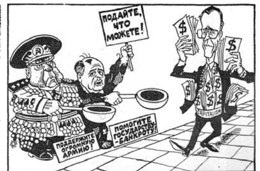
Рис. из пакистанской газеты 'МЭГЗИН'.