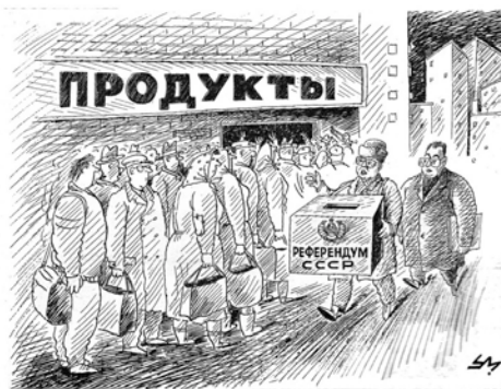
Рис. Александра УМИАРОВА