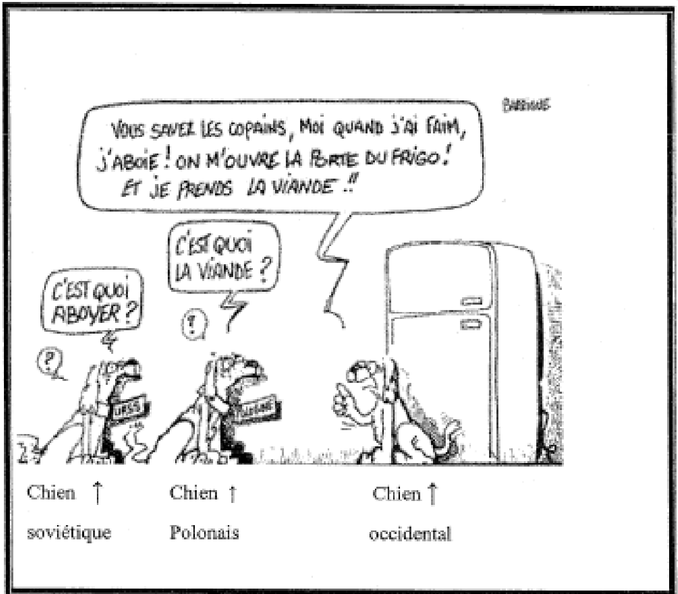
Caricature de Barrigues, La Suisse , 1987.