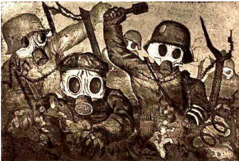
Scène de guerre. Dessin d'Otto Dix, 1924

1-Quelle guerre est représentée sur ce dessin ? Justifiez votre réponse en donnant deux arguments. /3