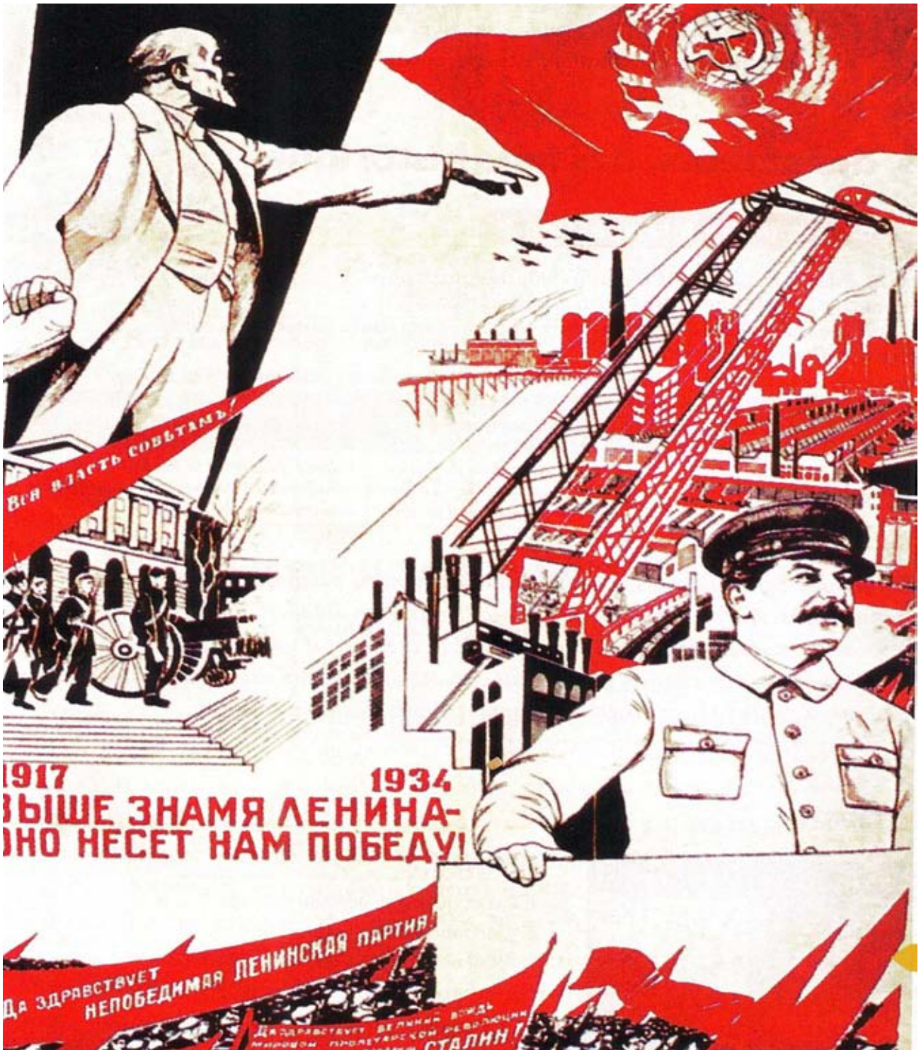
Affiche pour le congrès du parti communiste de 1934

Question 1 : Présenter le document (nature précise, date) 1pt