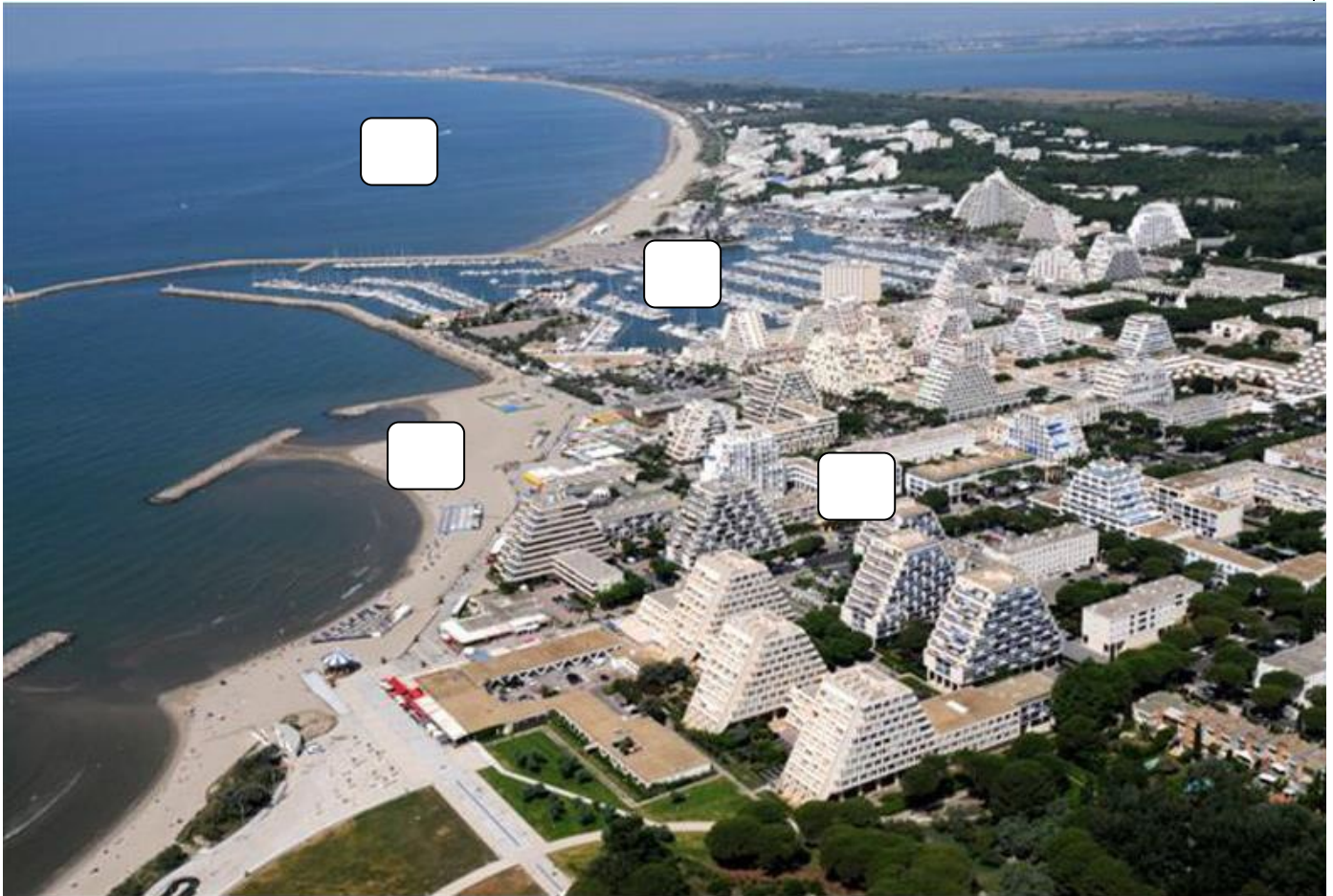
La Grande Motte vue du ciel.

La Grande Motte est une station balnéaire qui a été construite à partir de 1965, dans le cadre d'un programme d'aménagement du littoral lancé par l'Etat français, pour développer un tourisme de masse dans la région Languedoc-Roussillon.