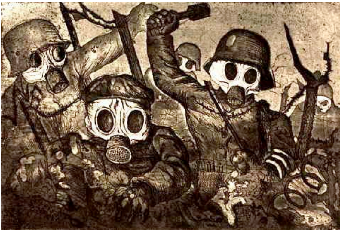
Scène de guerre. Dessin d'Otto Dix, 1924